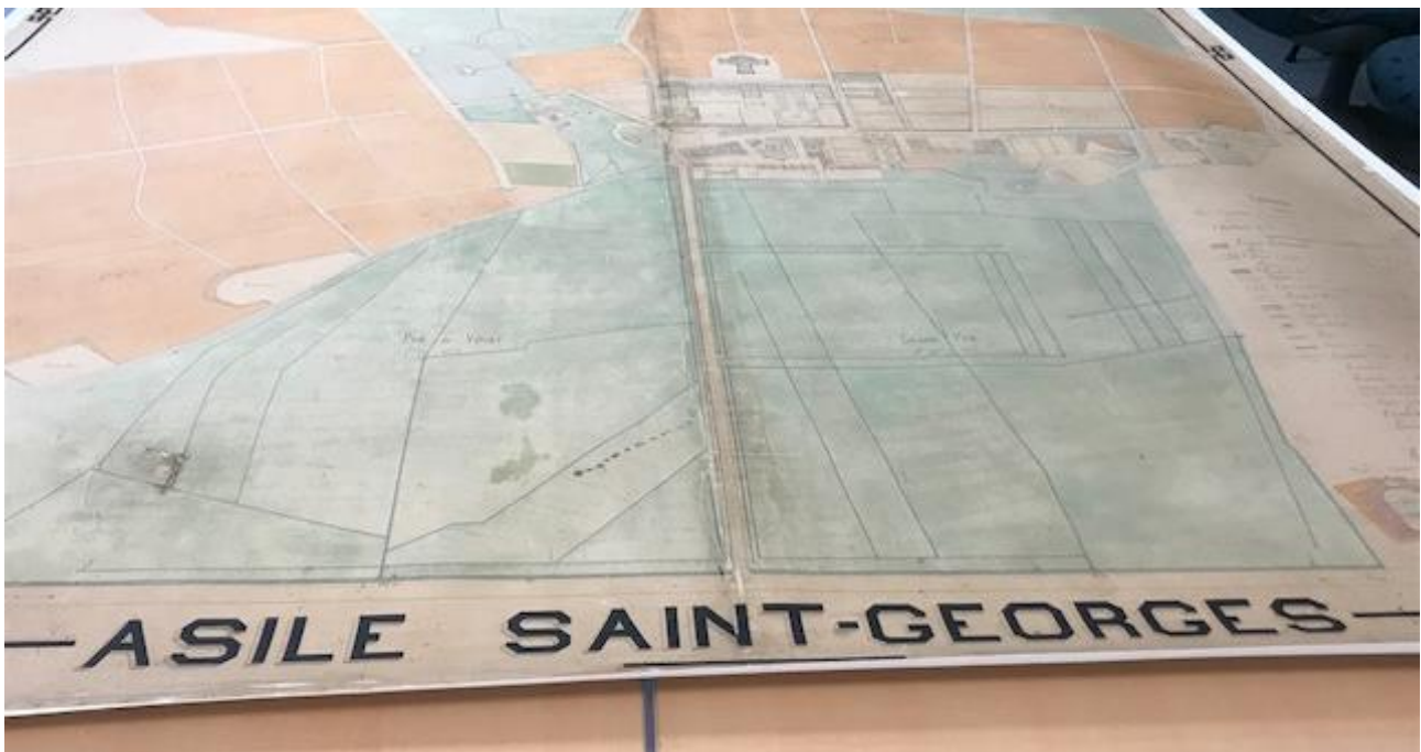
© Archives Départementales de l'Ain - H-dépôt CPA 1443

À l'automne 2019, associés à de nombreux partenaires, le dispositif Culture NoMad et le service central des archives lancent une exposition d'envergure sur l'histoire du Centre Psychothérapique de l'Ain, de la création des asiles départementaux au XIX e siècle jusqu'à demain. Cette exposition, retraçant une histoire de la psychiatrie dans l'Ain, est une première dans l'Ain.